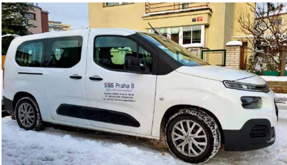
▲ Seniorům slouží dva vozy Citroen Berlingo