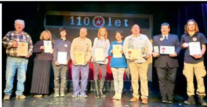
▲ Někteří členové souboru získali ocenění

Loutkové divadlo Jiskra působí v prostorách Divadla Karla Hackera, jehož zřizovatelem je MČ Praha 8. Historie souboru sahá až do roku 1913, kdy významná