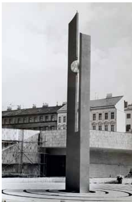
▲ Původní plastika na snímku z roku 1985

Věrná replika dvanáctimetrové ocelové konstrukce byla zhotovena v dílnách zámečnické firmy Kovo Lang v Jaroměřicích nad Rokytnou. Oba ukazatele času repasovala pražská firma Elektročas, která v 80. letech vyrobila i původní tabuli světového