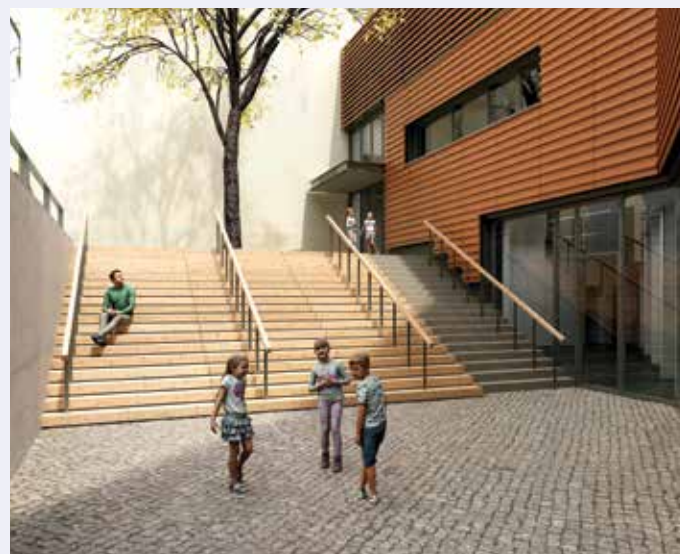
▲ Vizualizace Přístavba ZŠ Lyčkovo náměstí