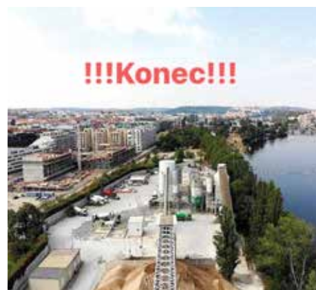
▲ Místo betonárny vznikne park

Podoba a využití území je už známá. Na 56 hektarech vznikne povodňový park z dílny ateliérů OMGEVING + FISER + VRV + SINDLAR, který propojí člověka s řekou a zachová tamní biodiverzitu. „Vítězný tým soutěže na podobu území nás přesvědčil tím, jak pracuje s terénem. Umožní rozšíření celkového využitelného území. Velmi dobře také zpracovává přístup k vodě, během celého procesu soutěžního dialogu jsme kladli důraz na zapojení místních obyvatel i stakeholderů. Naše spolupráce s hlavním městem výběrem vítěze nekončí. I dopracování návrhu bude provázet komunikace s místními obyvateli,“ doplnil k budoucnosti území místostarosta. (TK)