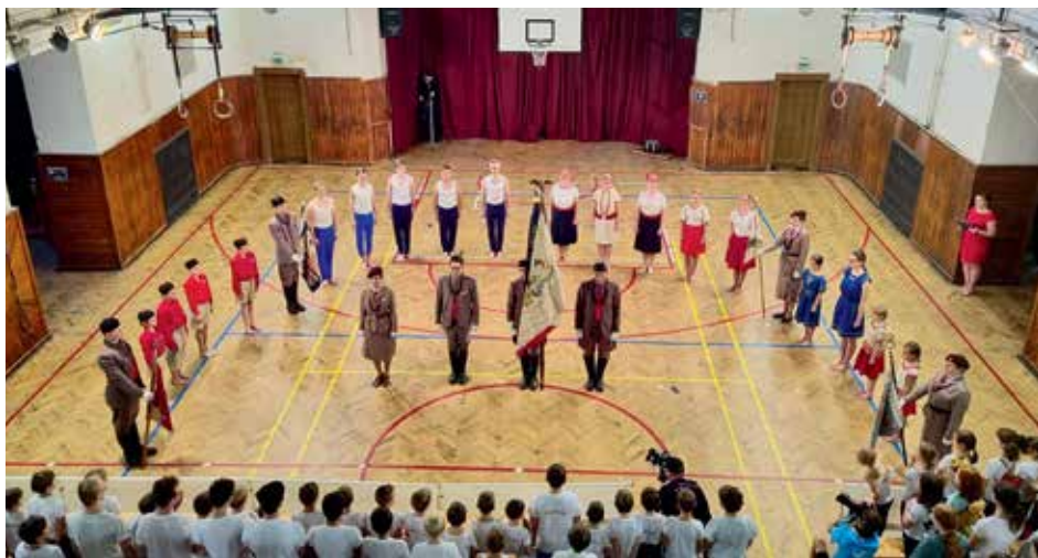
▲ Nástup členů sokolské jednoty s praporem

Kráčíte-li Zenklovou ulicí od metra Palmovka, povedou vás tramvajové koleje kolem mnoha zajímavých libeňských dominant, z nichž vyčnívá trojice architektonických kulturních památek: zámek, sokolovna a kostel sv. Vojtěcha.