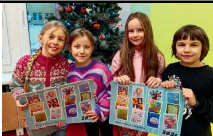
▲ Mezi dárci byly i děti ze ZŠ Glowackého

Obě školy upekly cukroví. K tomu ZŠ Glowackého již desátým rokem vyrábí krásné kalendáře z obrázků, které namalovaly děti v družině. Ty