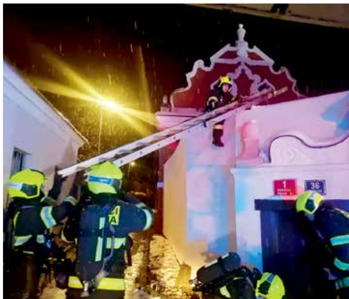
▲ Hasiči v Bohnicích odvedli profesionální práci

Podle radní Jany Solomonové (ANO) radnice se spolkem Bohnice žijí spolupracuje už řadu let a zdejší komunitní centrum se stalo velmi oblíbeným nejen pro místní obyvatele. „Vždy dokázali nabídnout