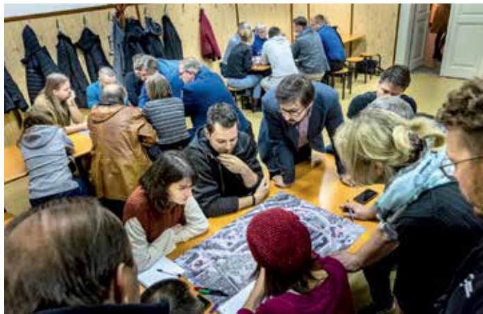
▲▶ Plánovací setkání se konala na různých místech

Praha 8 zadala zpracování dopravně-urbanistické studie, která přinese doporučení, jak dopravu v řešené oblasti lépe usměrnit, zhodnotit kvalitu a vhodnost použitých povrchů na silnicích i chodnicích, prověřit kapacitu parkování. Studie se