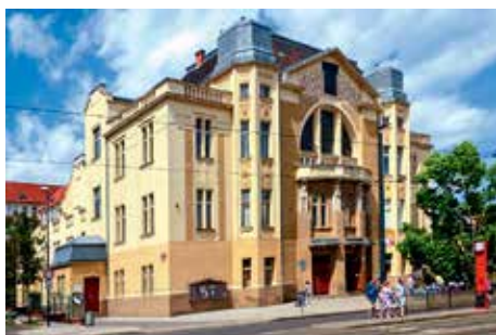
▲ Sídlo libeňského sokola vzniklo začátkem 20. století

...pomník JUDr. Jana Podlipného u libeňského zámku připomíná významného politického a sokolského činovníka (1848-1914), na jehož počest je pojmenována i župa, do níž spadá většina sokolských jednot na Praze 8 (Karlín, Kobylisy II., Libeň)?