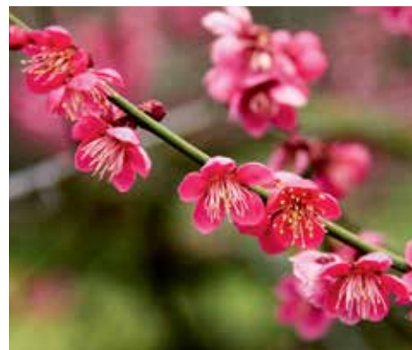
▲ Květy meruňky japonské můžete obdivovat hlavně v březnu