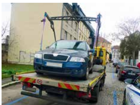
▲ Ze Srbovy ulice postupně mizí autovrakoviště

„Díky vyznačení zón placeného stání započaly odtahy vozidel, které nám tyto „dílny“ v místě zanechaly. V místě však i na-