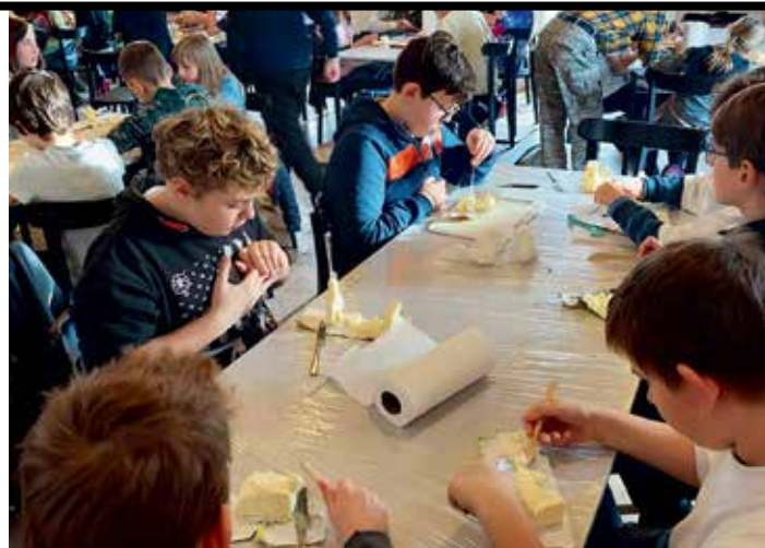
▲ Děti tvarovaly z másla figurky do betlému

Po tvoření jsme si prohlédli muzeum, kde jsme se dozvěděli, jak se máslo v domácnostech dřív stloukalo. Kromě této expo-