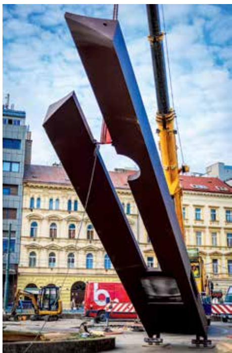
▲ Dvanáctimetrová konstrukce pochází z Jaroměřic nad Rokytnou

Unikátní dvanáctimetrové veřejné hodiny jsou po kompletní renovaci zpět na Florenci a znovu ukazují čas v Praze i desítky světových metropolí. Ikonická plastika akademického sochaře Rudolfa Svobody z roku 1985 dominovala prostranství u stanice metra Florenc do léta 2020, kdy musela být z důvodu rozsáhlé koroze sejmuta.