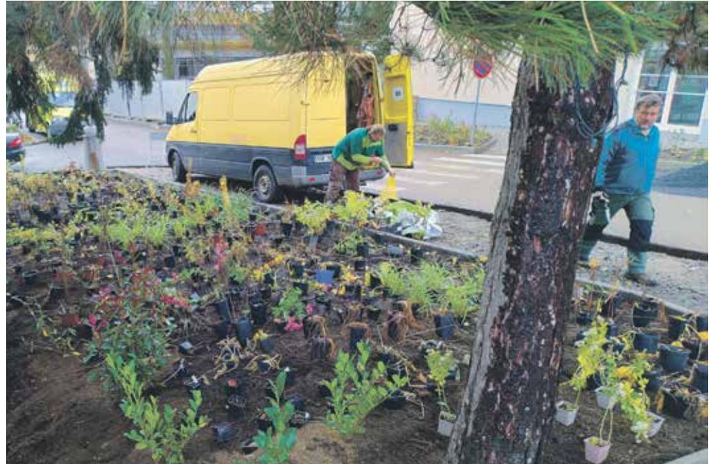
NA OSTRŮVKÁCH U NEMOCNIČNÍCH PAVILONŮ vznikají nové záhony, v minulosti například u onkologie, u budovy dlouhodobé ošetrovatelské péče či lékárny. Nyní byl osázen trvalkami prostor vedle pavilonu A, kde je pokladna či odběrové místo.

„Důkazem toho, že se snažíme o stromy pečovat, je, že jsme lípu před vstupem do nového centrálního vstupního pavilonu, která je nejstarším stromem