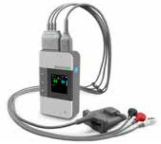
TELEMETRICKÝ SYSTÉM pro monitoraci EKG a SpO2.