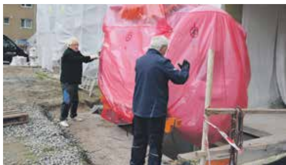
PŘIPRAVENÝM OTVOREM byla magnetická rezonance spuštěna do suterénu nové přístavby.