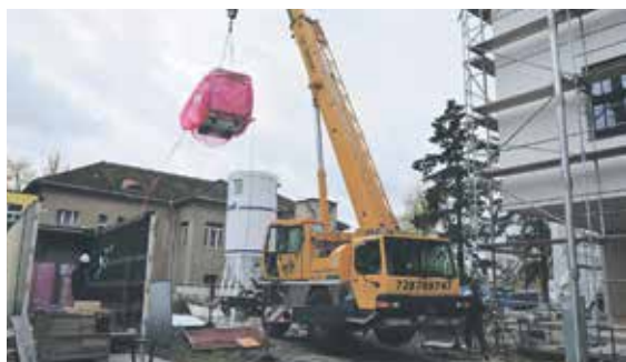
PŘÍSTROJ MUSEL PŘEMÍSTIT do přístavby chirurgie jeřáb.

V říjnu byl doslova přelomový den v historii Nemocnice Rudolfa a Stefanie Benešov. Instaloval se nový přístroj magnetické rezonance. Společnost Promedica dodala 31. října na místo svého definitivního určení do suterénu novostavby chirurgického pavilonu magnetickou rezonanci a započala s její instalací. Nemocnice tak má možnost využívat pro své pacienty ultramoderní magnetický scanner Siemens Magnetom Vida