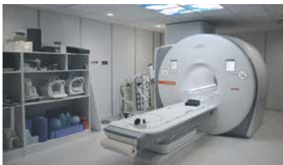
UMÍSTIT MAGNETICKOU REZONANCI na její místo trvalo odborníkům několik hodin.