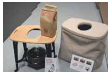
NOVINKA NA PORODNÍM SÁLE je židlička na bylinnou napařku, která před porodem pomáhá uvolňovat svaly pánevního dna, během porodu poskytuje úlevu a uvolnění.

Během covidu, kdy bylo zakázáno setkávat se ve skupinách, jsme natočili moc pěkné dvacetiminutové video, které je ke zhlédnutí na webových stránkách nemocnice. Takže maminky či tatínkové mohou zhlédnout toto video, ale také se hlásí na obnovená předporodní setkání, která vedu u nás na porodnici jednou za čtrnáct dní. Povídám jim, co si mají připravit do porodnice, kdy zhruba vyrazit, když přijdou kontrakce, a seznamuji je s tím, jak vedeme porody. Prohlédneme si porodní boxy, a když to dovoluje kapacita, nakoukneme i na nějaký pokoj. Setkání je pro dvanáct lidí celkem, včetně tatínků. Nyní když jsou tatínčí vtaženi do porodního děje víc, tak je zájem z jejich strany větší.