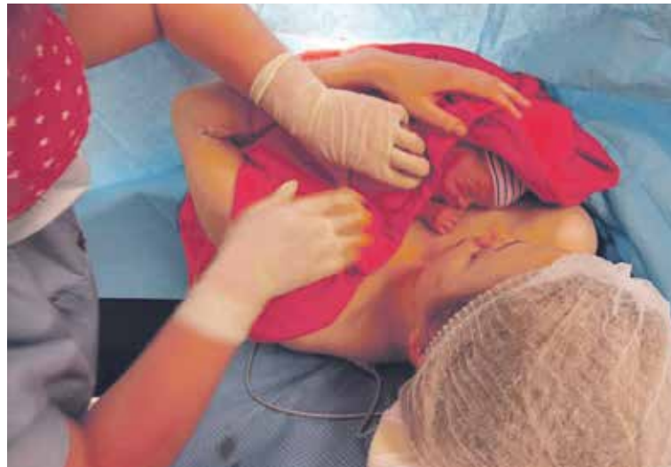
Při BONDINGU je miminko po porodu přiloženo na holý hrudník matky či otce, takzvaně skin to skin – kůže na kůži.

• Novorozenecké oddělení Nemocnice Rudolfa a Stefanie Benešov získá díky velkorysému daru ve výši 500 tisíc korun od společnosti Sellier & Bellot z Vlašimi nový monitorovací systém. Tento systém slouží ke sledování fyziologických funkcí novorozence a je velmi důležitý, především při monitorování miminka těsně po porodu ještě na porodním sále. Bude zakoupeno pět monitorů a dvě centrální stanice.