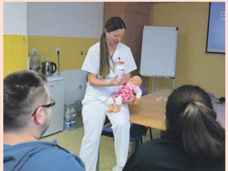
NA KURZY KOJENÍ SE HLÁSÍ čím dál více budoucích maminek i tatínek.

Rezervujte si své místo na telefonním čísle: 317 756 323 (porodní sál).