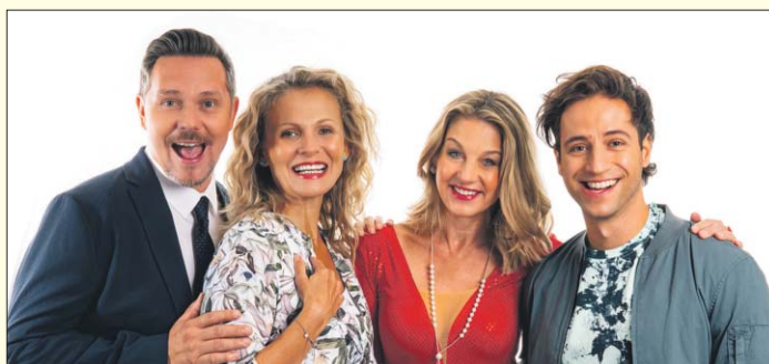
Hudební komedii Divadla Metro – Zlatička.