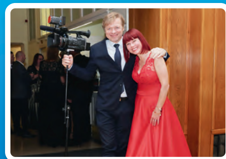
ÚČASTNÍCI SI PLES UŽILI!