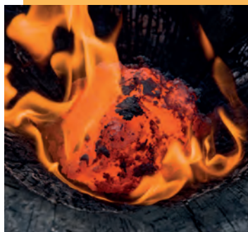
Experimentální tavba železné rudy

Výstava mapuje historii výroby a zpracování železa. Geologická část pojednává o minerálech železa, typech železných rud a jejich zpracování v České republice i v Evropě. Archeologická část prezentuje nálezy železných předmětů od nejstarších výrobků ze starší doby železné, přes početné nálezy doby laténské a velkomoravské. Na výstavě bude představena řada unikátních exemplářů z různých lokalit. Výstava je zapůjčená z Muzea jihovýchodní Moravy ve Zlíně.