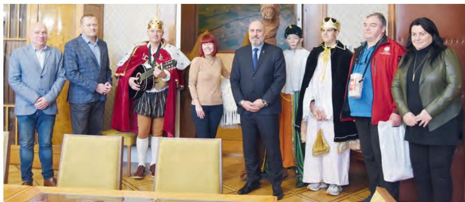
TŘI KRÁLOVÉ DORAZILI NA RADNICI