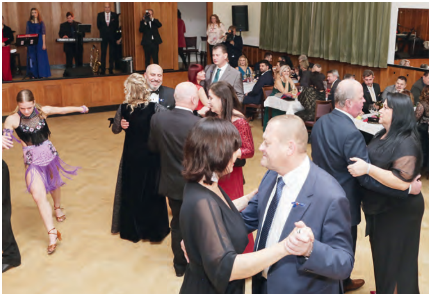
MĚSTSKÝ PLES ODSTARTOVAL LETOŠNÍ PLESOVOU SEZONU

Myslím, že výročí vzniku České republiky si zaslouží malou oslavu. Už je to 30 let, co jsme se přátelsky rozešli se slovenským národem a vydali se vlastní cestou. Ta obě země přivedla do Evropské unie a jsou z nás dobří sousedé s mimořádnými vztahy. Pro naše město má přítom partnerství se Slováky ještě zvláštní nádech. Počátkem 60. let minulého století se ze slovenského Prešova do Prostějova přestěhovala