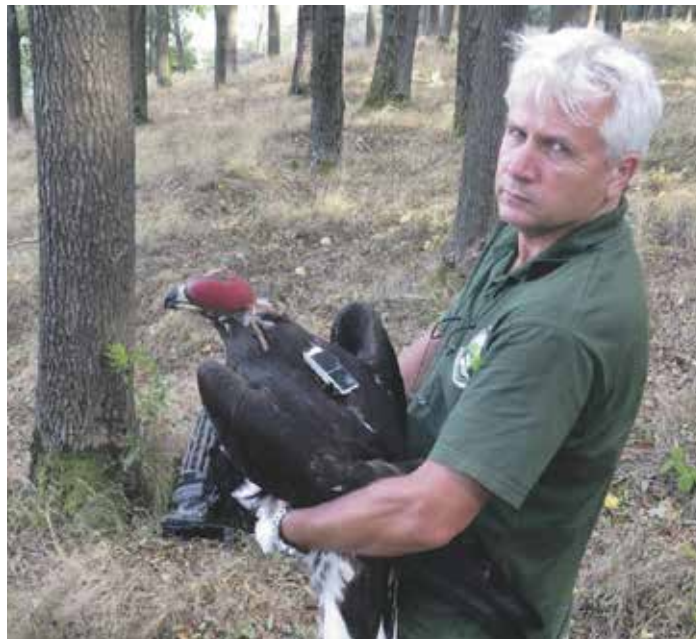
Orli skalní vysazeni do volné přírody jsou monitorováni vysíláčkami.

Jsem realista. Naši práci lze stále zlepšovat, vzdělávat se. Potřebujeme dobudovat pečovatelskou část, ve které zvířecí pacienty přijímáme a staráme se o ně. Když se to podaří, snad s tím budeme za dva roky hotovi. Důležitá je ale také práce v terénu, ochrana biotopů, ve kterých žijeme. Ten tlak na naši krásnou krajinu je enormní, vznikají nesmyslné stavby na nejurodnější půdě, větrné elektrárny v teritoriu nejvzácnějších druhů ptactva. Proti tomu budu nadále bojovat. Za místo pro přírodu, za kvalitní místo k životu pro nás všechny. ■