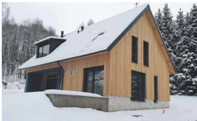
Celý proces koupě pozemků a projektu obou nových stanic započal v roce 2020, stavba pak trvala od června 2022 do listopadu 2023.

Stanice v Hynčicích je novou základnou pro celý okrsek Staré Město. Je umístěná přímo ve velkém lyžařském areálu Kraličák. „Z druhé strany Kralického Sněžníku je další rozlehlý areál Dolní Morava, kde máme samozřejmě také služebnu. Mít ale dvě služebny v dosahu dvou areálů a mít možnost v případě nutnosti rychle posilovat záchranářské kapacity je velká výhoda,“ pochvaluje si náčelník Kaller. Nová stanice poskytuje velkorysě kryté venkovní