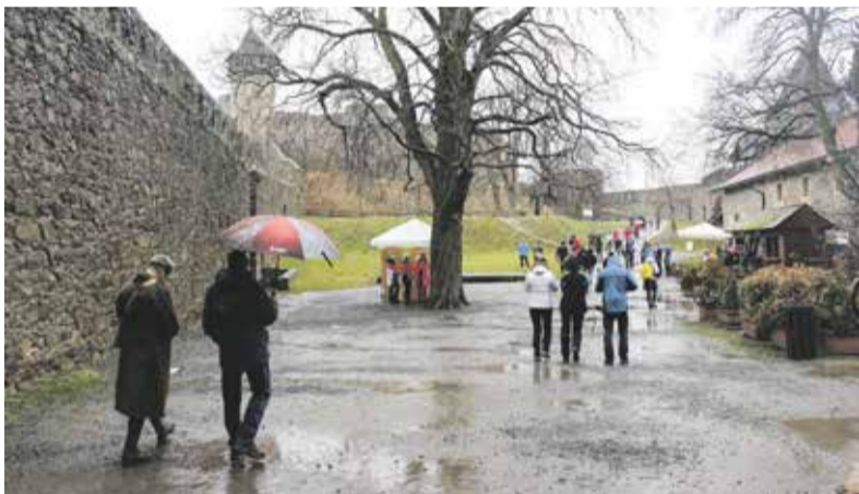
Letošní počasí novoročnímu výšlapu na Helfštýn nepřálo, i tak přišla během dne více než tisícovka návštěvníků.

První lednová sobota patří už od roku 1983 setkání turistů na hradě Helfštýn u Týna nad Bečvou. Letos kvůli deštivému počasí ale žádný rekord návštěvnosti překonán nebyl. Během dne si v areálu hradu koupilo vstupenku za padesát korun 1180 lidí. Výstupu se jako obvykle zúčastnili zástupci různých spolků a klubů, někteří z nich i ve vojenských stejnokrojích a historických kostýmech.