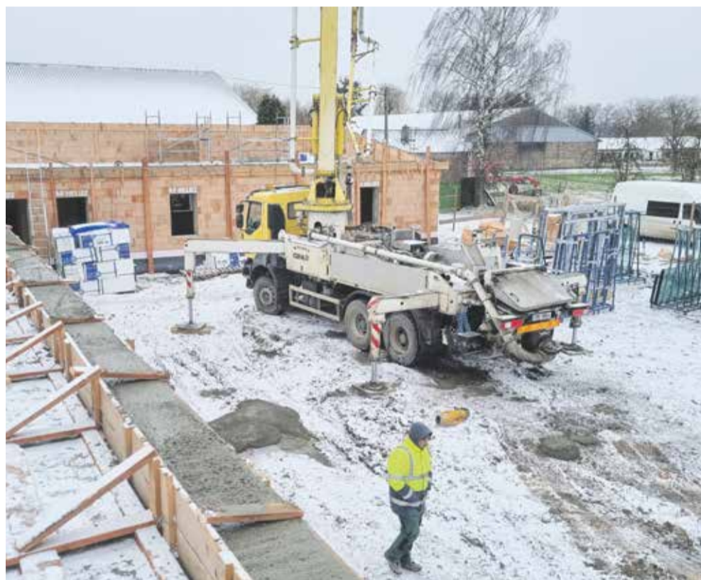
Jednou z významných investic loňského roku byla stavba rodinného domu pro klienty sociálních služeb z Nových Zámek, kteří v rámci transformace získali vlastní bydlení. Dům v obci Králová byl slavnostně otevřen v pátek 12. ledna.

Významné budou také investice do sociální oblasti. Domov pro seniory na