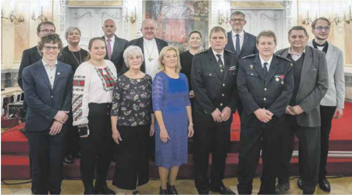
Ocenění Křesadlo si dobrovolníci převzali na slavnostním večeru v Arcibiskupském paláci v Olomouci.