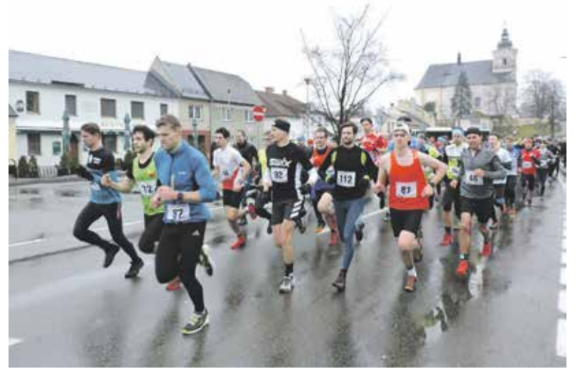
Na start prvního závodu sezony se postavilo 170 vytrvalců, kteří vyběhli na Kosíř.

Celoroční seriál běhů nemá v tuzemsku konkurenci a mívá kdysi maximálně do dvacítky dílů, s příchodem velkého běžeckého boomu předchozích let však postupně narůstal a několikrát rokem čítá nejméně padesát závodů. Mezi významné a oblíbené podniky sdružené pod hlavičku Velké ceny vytrvalců Olomouckého kraje patří vedle úvodního Zimního běhu přes Kosíř třeba také Rohálovská