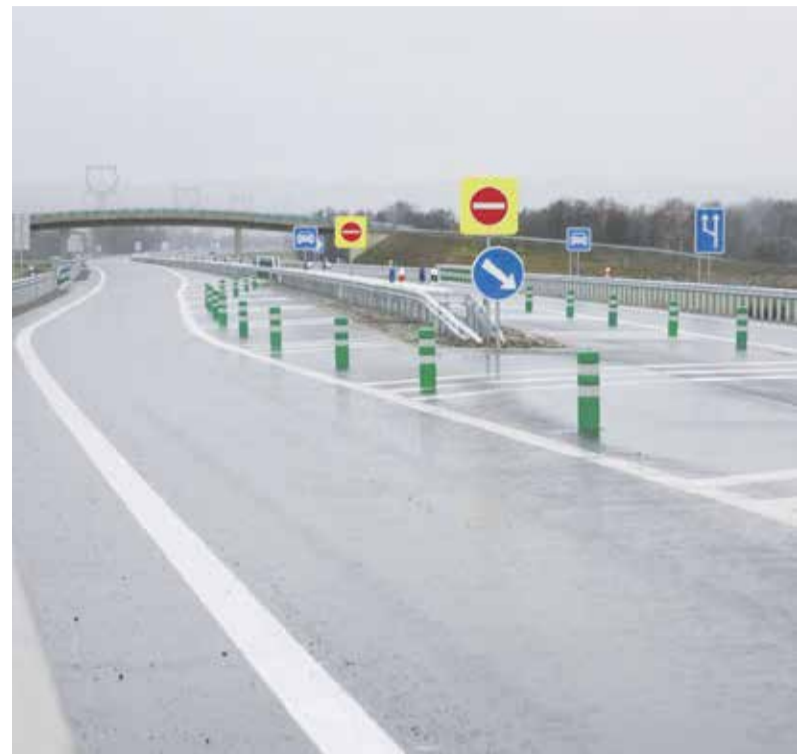
Obchvat Bludova odvedl tranzitní dopravu mimo obec a zrychlil propojení mezi Zábřehem a Šumperkem

Kompletní rekonstrukci má za sebou za zhruba dvacet a půl milionu korun silnice v obci Blatce i vozovka směřující do části Kocanda. S rekonstrukcí začali silničáři loni v srpnu. „Špatný stav silnic druhých a třetích tříd trápí Olomoucký kraj dlouhodobě. Postupně se je snažíme