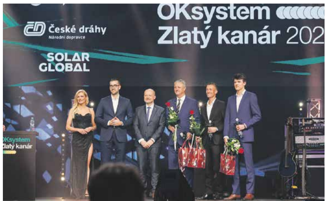
Nejlepší čeští tenisté převzali ocenění v tradiční anketě Zlatý kanár. Její 31. ročník vyhlásili za účasti zástupců Olomouckého kraje v polovině prosince v Přerově. Žebříčku dominovala wimbledonská šampionka Markéta Vondroušová, která titul v kategorii Zlatý kanár získala poprvé. Čtyřicetiletá rodačka ze Sokolova získala také ocenění pro nejlepší hráčku roku. Mezi muži vyhrál potřetí za sebou cenu pro nejlepšího tenistu roku čtvrtfinalista Australian Open Jiří Lehečka. Kompletní výsledky ankety najdete na webu Olomouckého kraje.