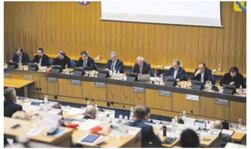
Rozpočet na rok 2024 schvalovalo zastupitelstvo 11. prosince. Návrh prošel beze změn.

Rozpočet obsahuje řadu dotačních programů, například jde o peníze na rozvoj venkova nebo podporu SMART technologií.