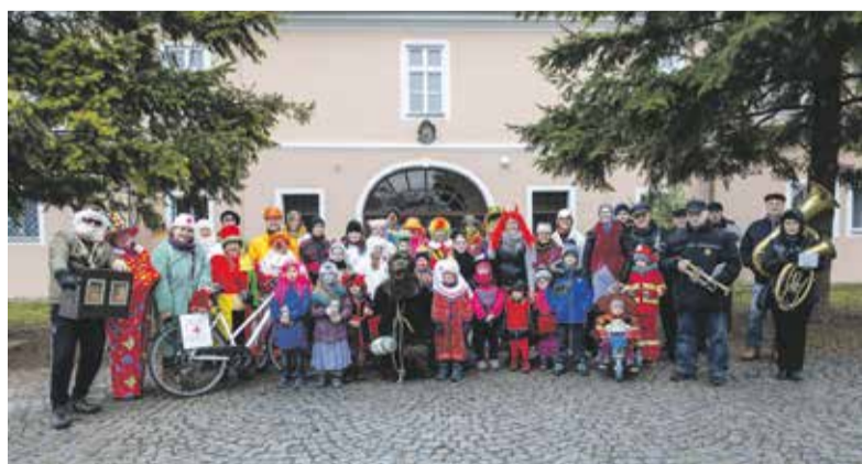
Masopust a vodění medvěda se účastní téměř celá obec.

V posledních letech prošly naše obce dynamickým rozvojem, a to ve všech směrech. Zatímco Česko trápila demografická krize, u nás školka i obě školní budovy praskaly a praskají ve švech. Nárůst obyvatel za posledních dvacet let dosáhl téměř padesátiprocentní hranice. Podílela se na tom především výstavba nových rodinných domů v lokalitě Podštampilí, resp. menší rozvojové lokality ve všech místních částech. Velký Týnec se stal dobrou adresou, psal nedávno Olomoucký Deník. A měl pravdu, protože nabízí svým občanům téměř veškerou