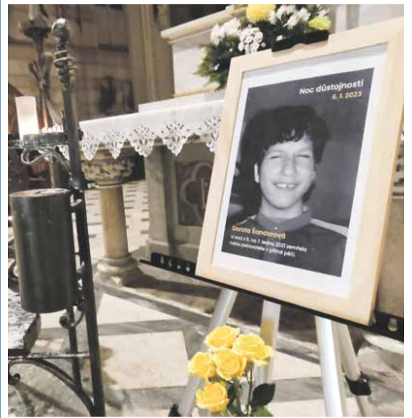
K Noci důstojnosti se lidé v Olomouci připojili již podruhé. Akce upozorňuje na potřebu změny péče z ústavni na komunitní, aby mohli lidé s mentálním postižením žít důstojně a ve svém přirozeném prostředí.