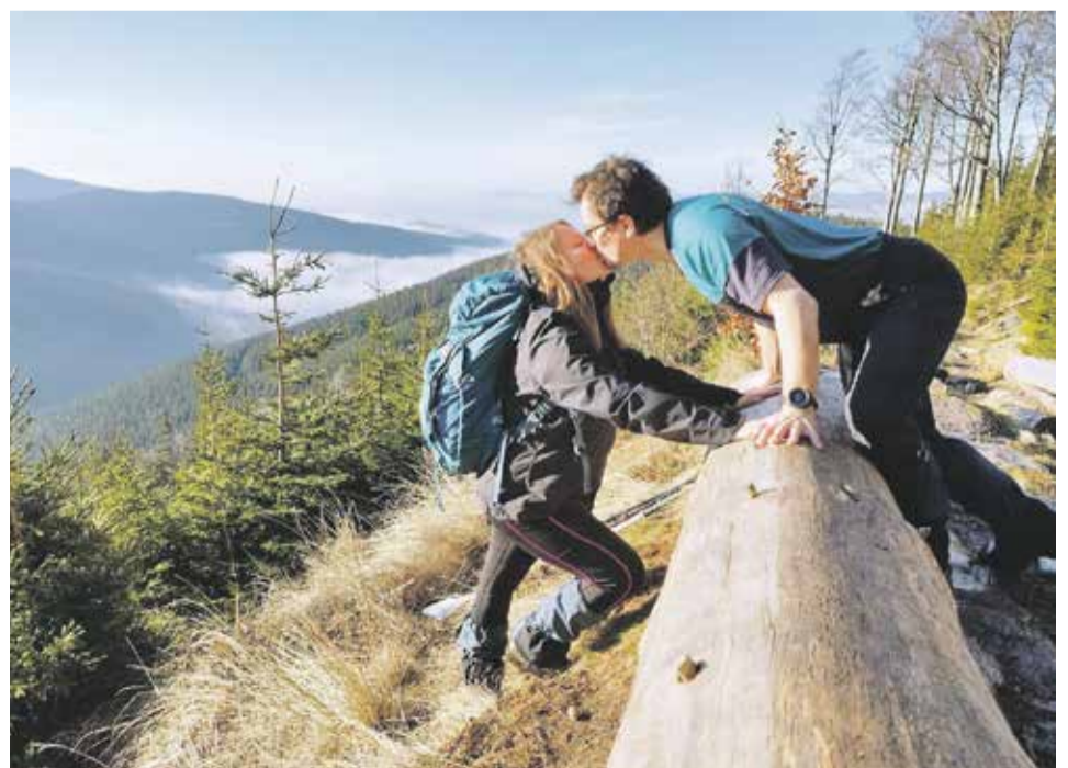
Chvilka sluníčka po cestě na Šerák

Sledujte náš facebook, kde začátkem února zveřejníme další fotosoutěž.